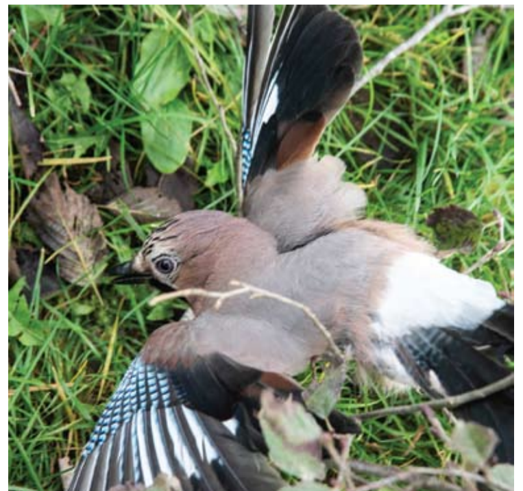
Kėkšto spalvos primena Estijos vėliavą.

Iš karto supratau, kad nepavyks, nes jo kojos buvo ap-