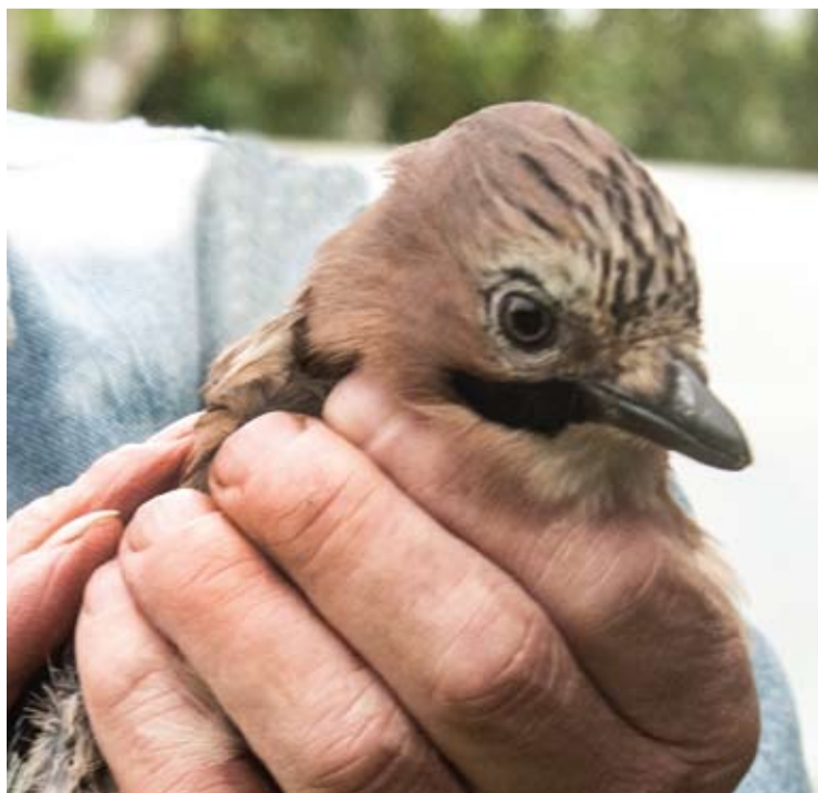
Kėkštas kantriai iškentėjo „operaciją“.