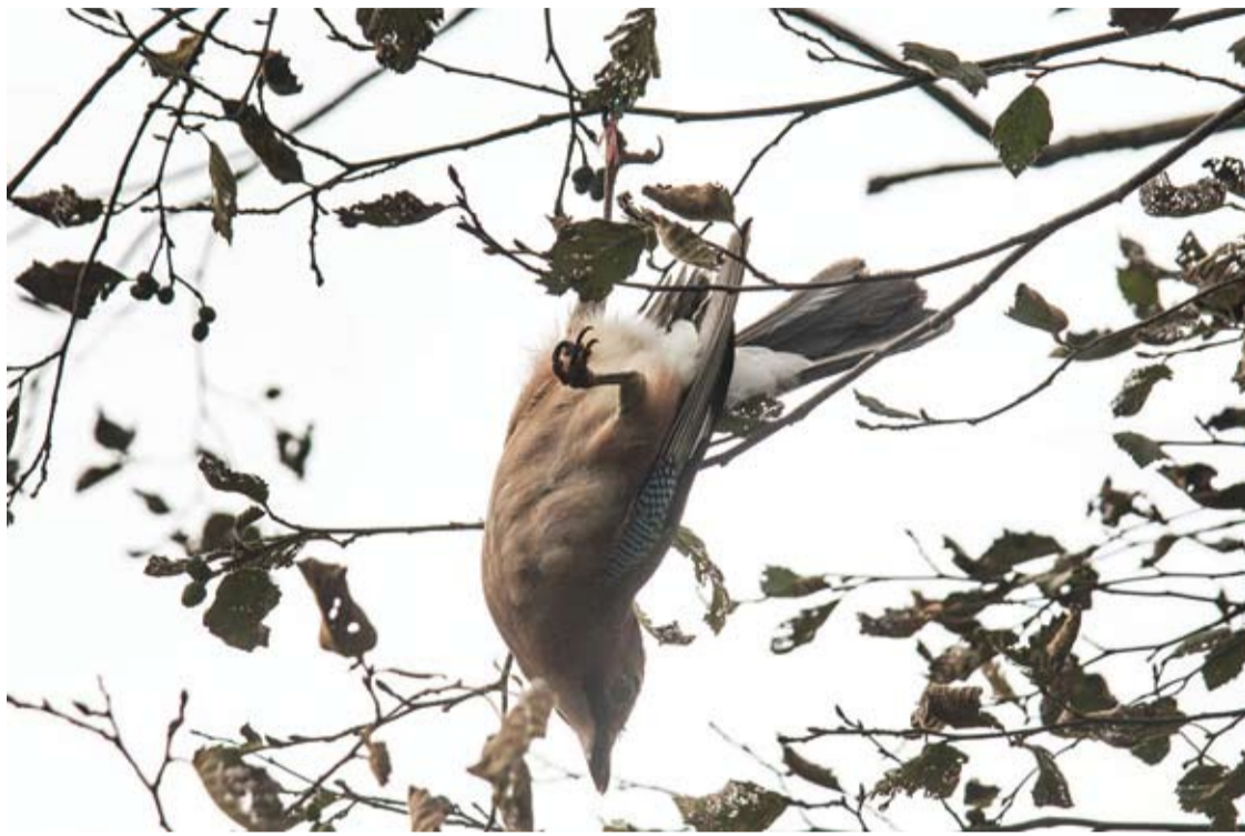
Nelaimėlis kėkštas rėkdamas pakibo žemyn galva ant alksnio, augančio prie upės, šakos.

Prie Šventosios upės, ties „Elmos“ sodų bendrija, į aukšto alksnio šakose paliktą ilgą žvejybinio valo galą su šešiais kabliukais įsipainiojo kėkštas. Paukštį pavyko išgelbėti, tačiau tam prireikė dviejų žmonių pagalbos, po kurios kėkštas nuskrido į mišką.