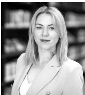
Psichiatrė dr. A. Leleikienė teigia, jog vienas iš priklausomybę išduodančių požymių yra didžiulė emocijų kaita bei jų nepastovumas.