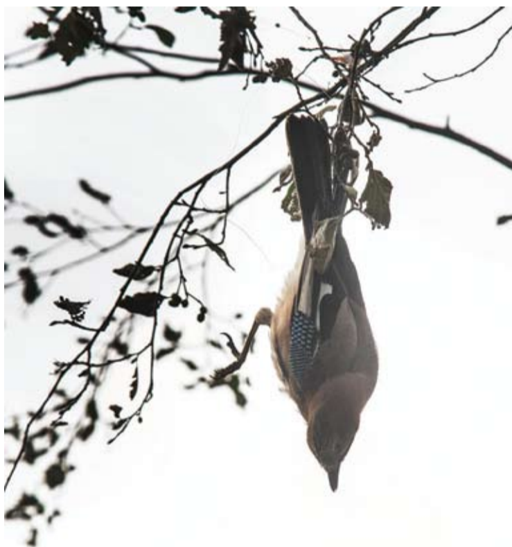
Kėkšto kojytė įsipainiojo į meškeriojo alksnyje paliktą valą su kabliukais, kurie sužalojo paukštelį.