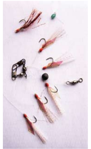
Ant žvejybinio valo gniutulo buvo šeši kabliukai, kurių vienas buvo įsmigęs į kėkšto kojytę.

raizgytos valų, o į kojytę giliai įsmigęs kabliukas.