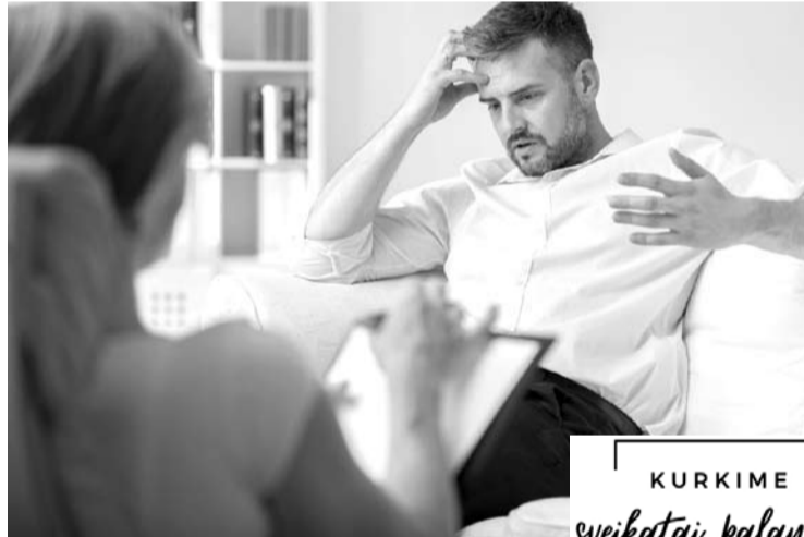
Priklausomybė daro didžiulę įtaką asmens gyvenimui, tačiau svarbu kreiptis pagalbos ir suvokti, jog tai yra išgydoma.

„Turėjau gerai apmokamą darbą, studijavau viename iš geriausiai vertinamų šalies universitetų, lankiau paskaitas, seminarus ir rašiau baigiamąjį darbą. Buvau ir vis dar esu perfekcionistė, todėl padaryti „bet kaip“ – negalėjau sau leisti, – pasakojo ji. – Miegodavau po kelias valandas per parą, mažai valgydavau, gyvenau nuolati-